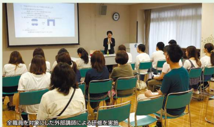
全職員を対象にした外部講師による研修を実施

利用者一人一人に寄り添う介護を目指すせきこもれびでは、職員の技術や知識の向上を目指して、毎年外部講師を呼んだ全職員対象の研修を開催しています。また、厚生労働省が進める「キャリア段位制度」を採用し、職業能力を評価することで、職員のモチベーションアップやキャリアへの意識を醸成。医療法人とも連