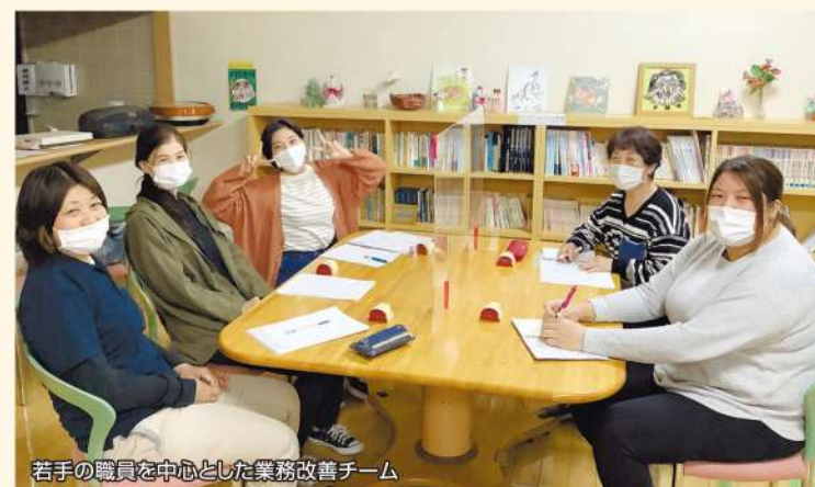
若手の職員を中心とした業務改善チーム

社会福祉法人 イーストヘルスケアソサエティ 特別養護老人ホーム コート・スマイル